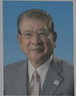
代表取締役 笹川 堯

当社は小売電気事業者である(株)エージーピーの代理店となり、空手のオリンピック選手などの育成を目的に電気の小売事業(沖縄地区以外)をおこなう事となりました。